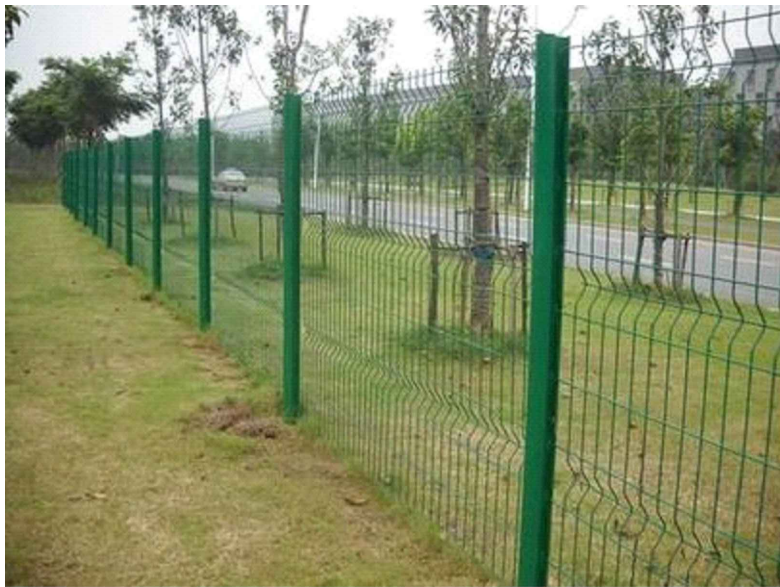
② 隔离镀锌护栏效果图